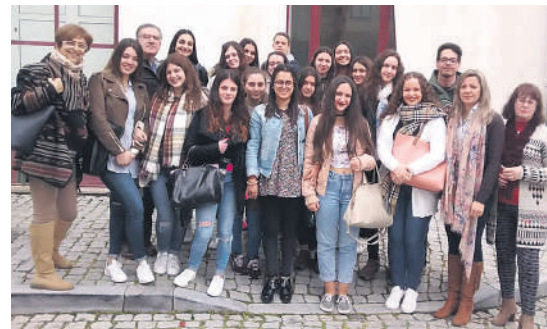
Visita ao Arquivo Municipal da Covilhã - Alunos do 11º ano do Curso Profissional Técnico de Secretariado.