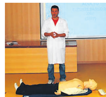
Suporte Básico de Vida com as turmas de 11ºano e a equipa de Enfermagem do Centro de Saúde da Covilhã.