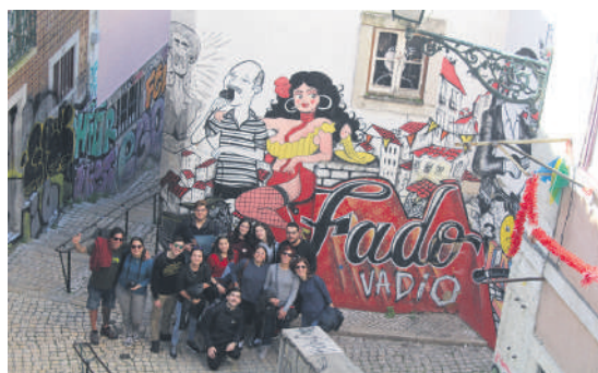
O Clube de Teatro em Lisboa