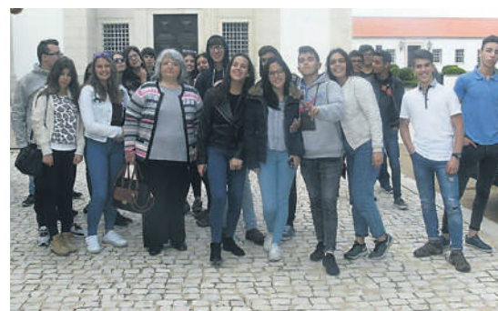
As Turmas dos Cursos CEFs e o 11ºD1 na Aldeia da Vista Alegre.