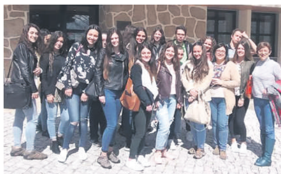
A turma do 11º F em visita ao Setor de Expediente da UBI - Plataforma Eletrónica “GDUBI”.