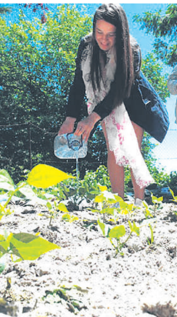
Aula no Jardinoscópio